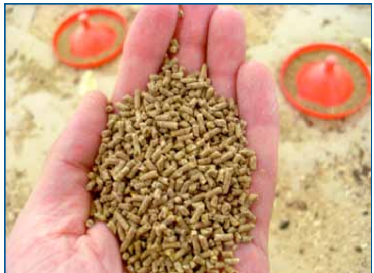
Схема 4: Образец гранулированного корма высокого качества