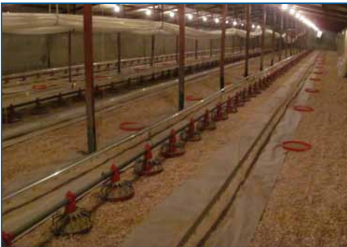
Схема 2: Образец оптимального оборудования птичника в начале производства.

Благодаря генетическому совершенствованию суточного мясного привеса, брудинговый период (первые 10 дней) теперь представляет почти 25% общего жизненного цикла птицы. Брудинговый период является критическим временем в развитии и активности функции кишечника, который способен эффективно усваивать корм. Таким образом, создание верного температурного режима в этот период (Схема 2), является критическим для общих производственных показателей и эффективности утилизации корма.