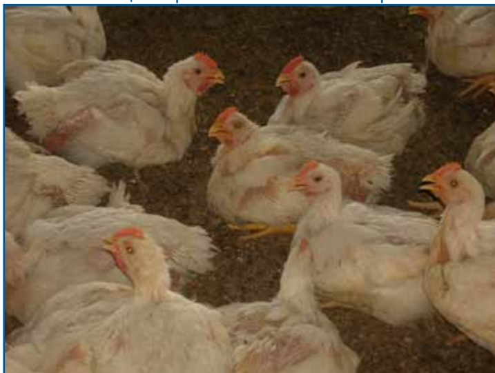
Схема 3: Птицы с признаками теплового стресса

к росту FCR. Если температура окружающей среды поднимается выше комфортной (т.е. птице становится жарко), то потребление корма снижается, рост птицы замедляется и кормоконверсия стада будет выше нормативной (Схема 3). Если сравнительная влажность слишком высока, то высокая температура окружающей среды становится еще более серьезной проблемой, так как птице становится труднее выделять избыток тепла. Для компенсации этого необходимо снизить температуру по сухому термометру. Если относительная влажность слишком низкая, то температуру сухого термометра следует увеличить, чтобы создать птицам комфортные условия. Наблюдение за поведением птиц является наиболее эффективным способом контроля условий окружающей среды.